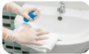
ใช้ได้กับพื้นผิวทุกประเภท