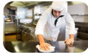
ใช้ได้กับพื้นสำหรับประกอบอาหาร