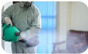
พ่นในอากาศ/พื้นผิว